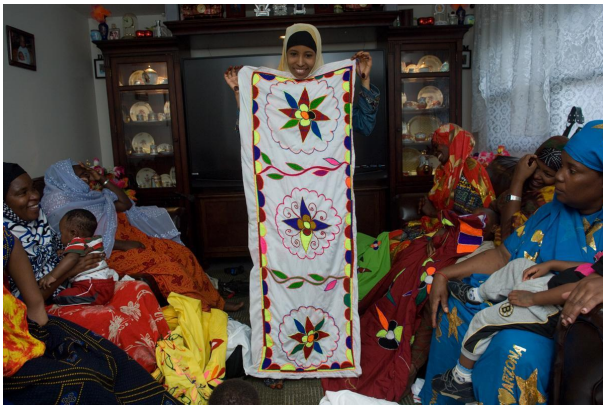
Вышивка сомалийского банту