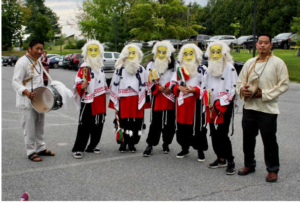
Таши шупа - тибетская музыка и танец