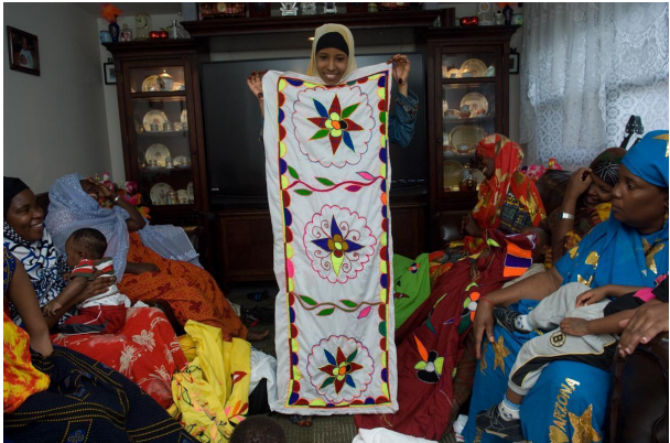
Somalijski- Bantu vez