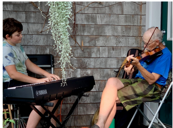
New England Plesna Muzika