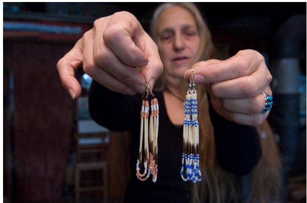
Abenaki rad sa perlama